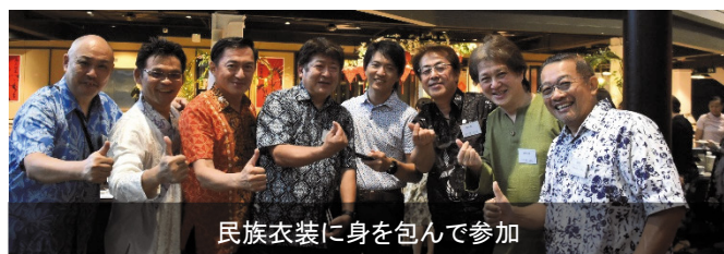
民族衣装に身を包んで参加

2016 年の学友会設立時に 39 人だった会員数は 10 年を経て 100 人を超える規模へと成長しており、マレーシア米山学友会のさらなる飛躍が期待されます。