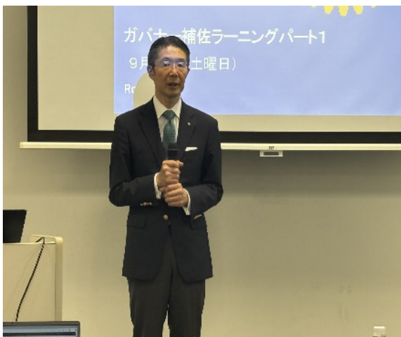
(高橋地区ラーニング委員会委員長)

その後、地区ラーニング委員会により、ガバナー補佐就任までのスケジュール感や活動準備についてメインにラーニングを行いました。ガバナー補佐の活動は多岐に渡ります。