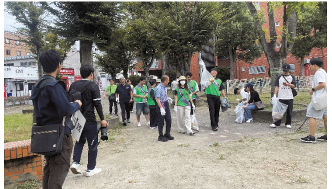
各グループで公園内を清掃

参加者は春日部駅から公園に移動し、清掃用具の配布と注意事項の説明を受けた後、4グループに分かれて春日部駅周辺の各ルートを歩きながら清掃活動を行いました。