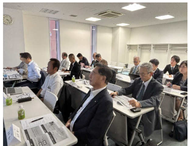
(ラーニングを受講するガバナー補佐候補)